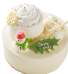
③フランスブルターニュ産クリームチーズ使用 Xmas トリプルチーズデコレーション