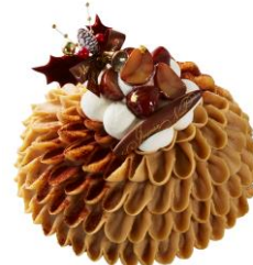
⑤熊本県産和栗使用 Xmas モンブランデコレーション