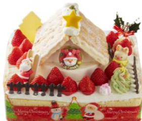
⑦Xmas サンタハウスデコレーション