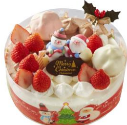
②Xmas 2 つの味が楽しめるデコレーション