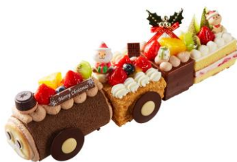
⑥Xmas フルーツトレイン