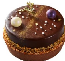
④Xmas ショコラドラムデコレーション