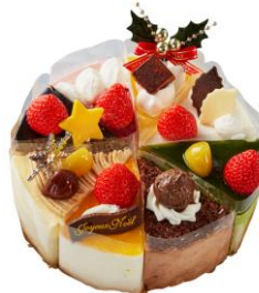
⑧Xmas アソートデコレーション