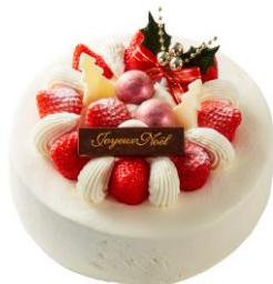
①Xmas 苺デコレーション