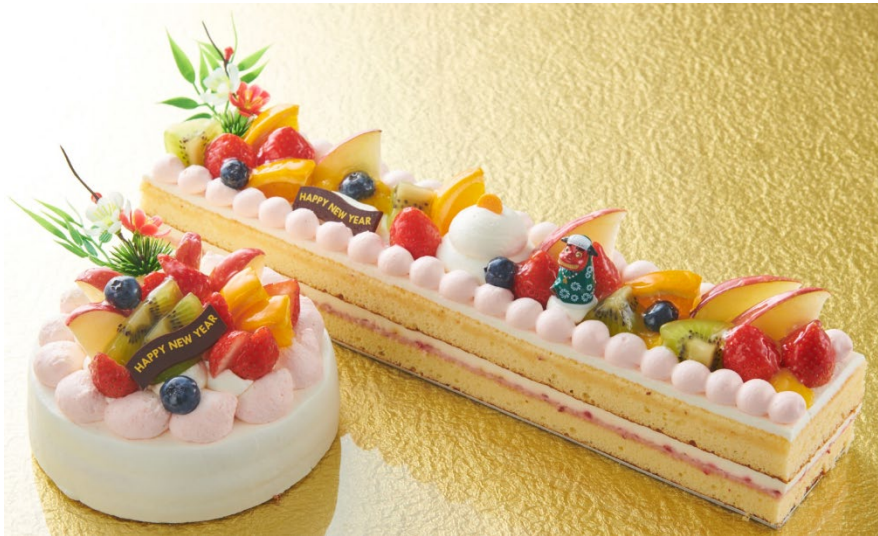
写真左から、「2020 HAPPY NEW YEAR デコレーション」「HAPPY NEW YEAR フルーツロングデコレーション」

菓子専門店「シャトレゼ」を国内 531 店舗、海外 8 ヶ国・地域 62 店舗展開する菓子メーカー、株式会社シャトレゼ（本社：山梨県甲府市、代表取締役社長：古屋 勇治）は、年末年始を彩る期間限定スイーツを 12 月 28 日より発売致します。