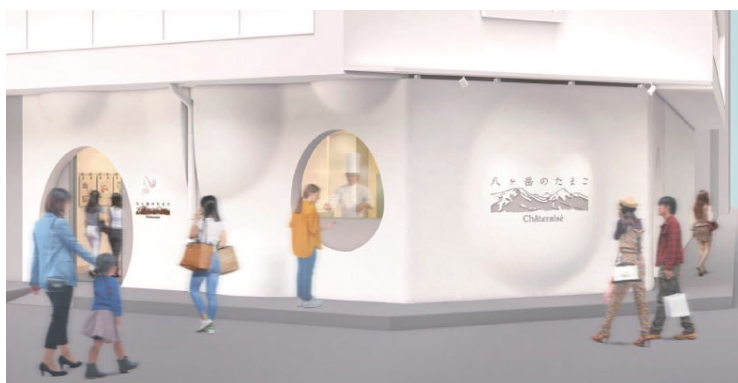
※店舗外観イメージ

シャトレーゼの素材へのこだわりを発信する、お菓子の素材として重要な役割を果たしている「たまご」に特化したたまごスイーツ専門店「シャトレーゼ八ヶ岳のたまご」を、南池袋にオープンいたします。店舗では、シャトレーゼと卵農家で協働開発した専用卵「八ヶ岳の恵み」を使用したスイーツ 3品の、作りたての美味しさをご提供いたします。